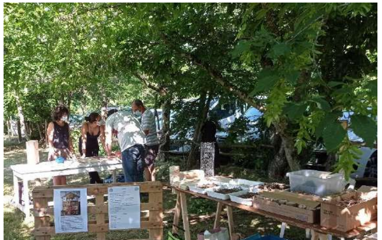
Le vendredi 11 juin 2021 à Saint Amant en Puisaye.

50 participants à l'événement, 12 enseignants et animateurs du péri-scolaire inscrits à l'atelier proposé par l'OCCE.